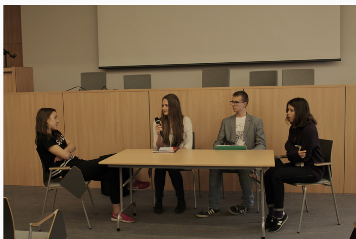
Mediatorzy rówieśniczy

W kolejnych latach grono mediatorów rówieśniczych powiększało się, a w bieżącym roku szkolnym nauczyciele zgłosili zapotrzebowanie na szkolenie mediacyjne, ponieważ zauważyli że stosowanie tej metody daje sukcesy – zmniejsza stres związany z konfliktem. Na terenie szkoły pracuje obecnie 12 mediatorów rówieśniczych oraz 6 mediatorów dorosłych – nauczycieli V LO. Co daje im mediacja? Umiejętności komunikacyjne, zarządzania konfliktem, przeciwdziałania zjawisku przemocy w szkole i innych miejscach w których na co dzień przebywają młodzi ludzie. Daje też poczucie odpowiedzialności za własne konflikty i wdrażanie w życie ich rozwiązań.